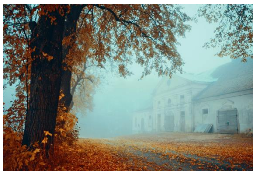
Tarvastust pärit ja rahvusvaheliselt tunnustatud noor fotograaf Hendrik Mändla. PS! foto kasutamiseks Mulgi mälumängus on autorilt luba küsitud ja olemas.

valminud Tarvastu mõisa stiilne klassitsistlik ait